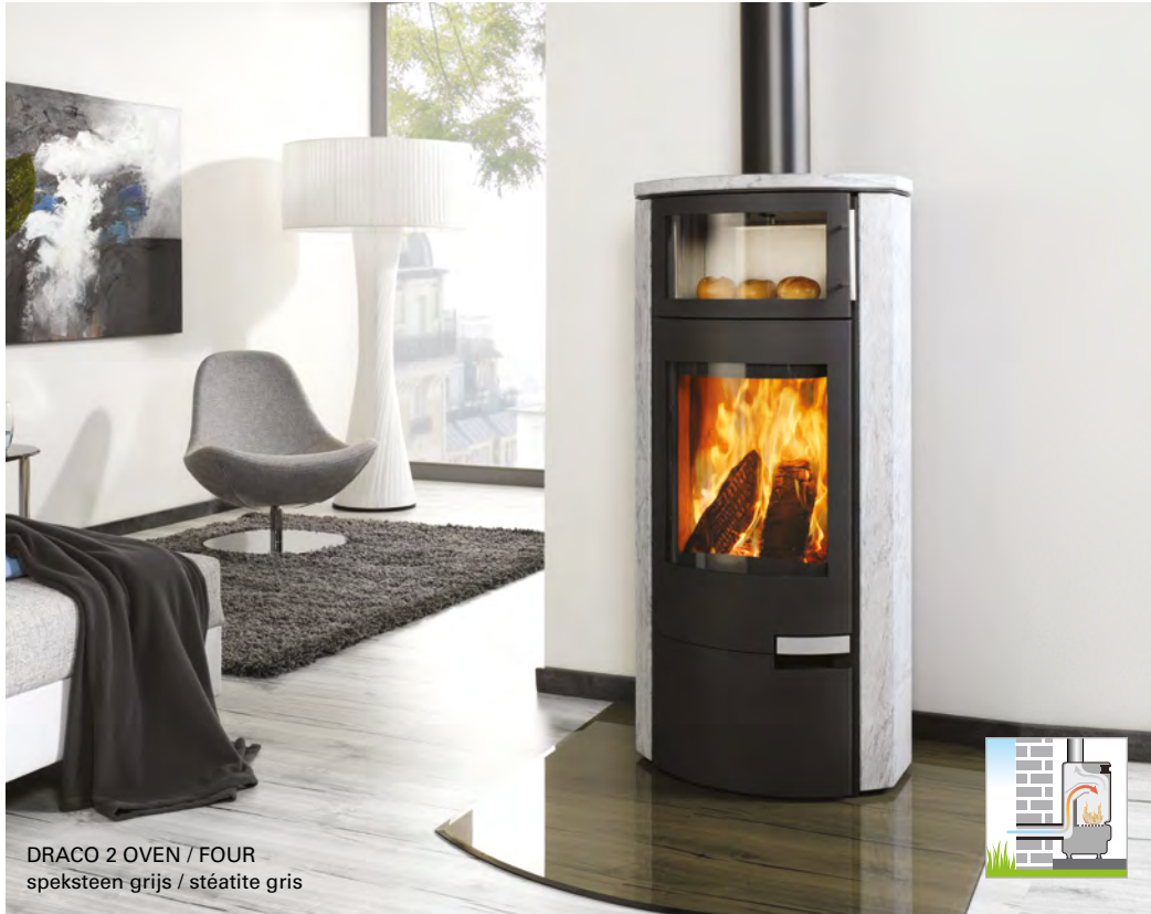
DRACO 2 OVEN / FOUR speksteen grijs / stéatite gris

Grote strakke kachel met lichtgebogen deur en oven bovenaan.