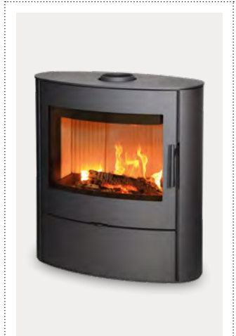
ELLIPS staal donker antraciet acier anthracite foncé

Une belle vue panoramique sur les flammes dans un design souple et courbé.