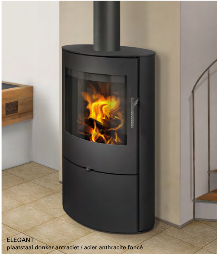
ELEGANT plaatstaal donker antraciet / acier anthracite foncé