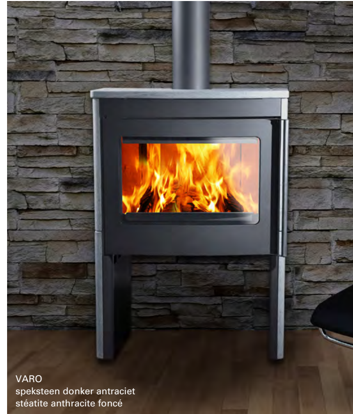
VARO speksteen donker antraciet stéatite anthracite foncé