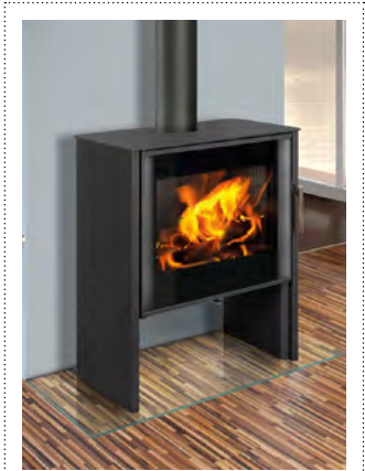
MURIA DECO staal donker antraciet acier anthracite foncé