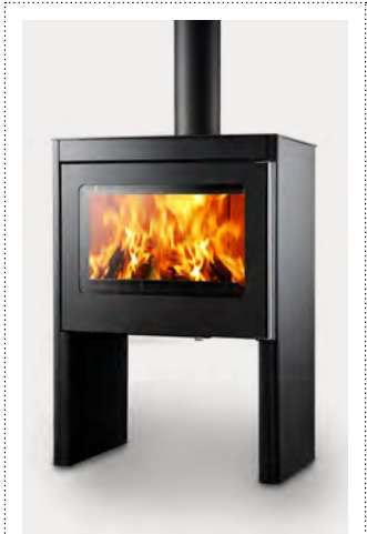
VARO plaatstaal donker antraciet acier anthracite foncé