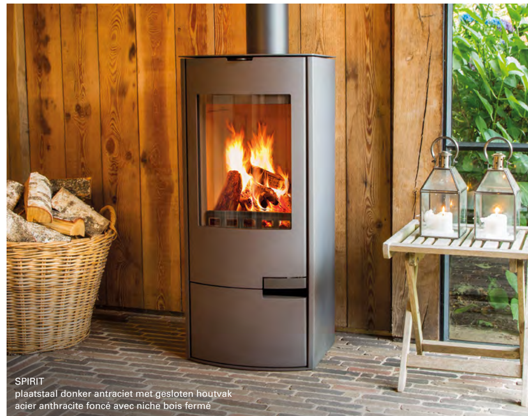
SPIRIT plaatstaal donker antraciet met gesloten houtvak acier anthracite foncé avec niche bois fermé

Strak, eenvoudig en tijdloos: de Spirit Staal !