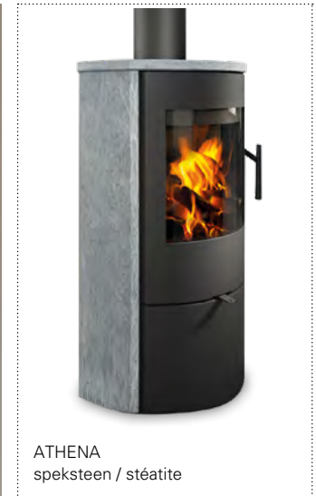
ATHENA speksteen / stéatite

→ gesloten houtvak → gebogen ruit → buitenluchtaansluiting Ø 120 mm achter en onder