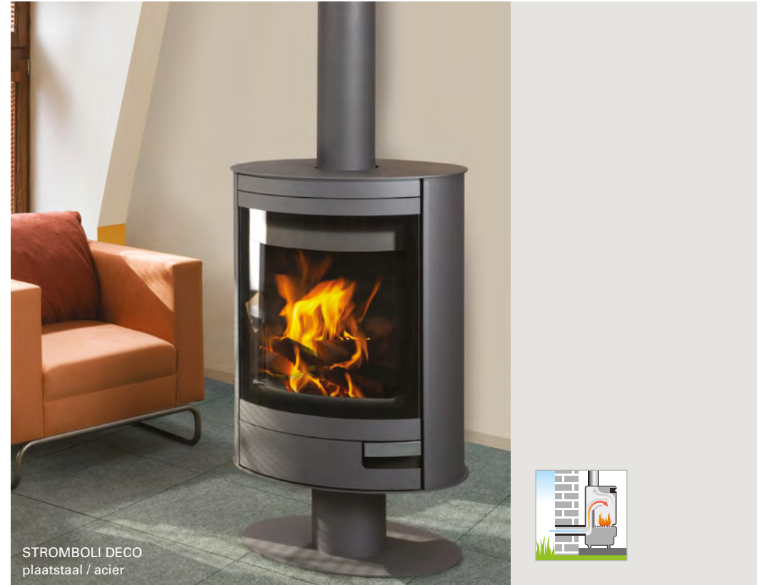
STROMBOLI DECO plaatstaal / acier