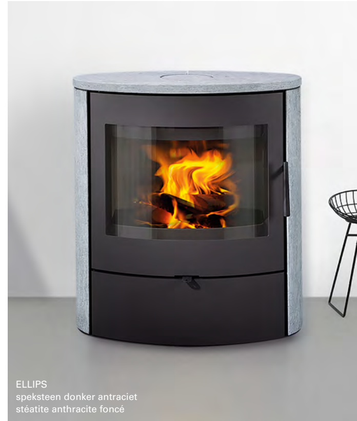
ELLIPS speksteen donker antraciet stéatite anthracite foncé

Een prachtig panoramisch beeld in een zachte, gebogen vormgeving.