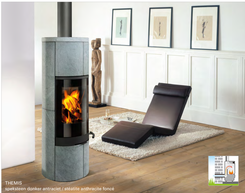
THEMIS speksteen donker antraciet / stéatite anthracite foncé