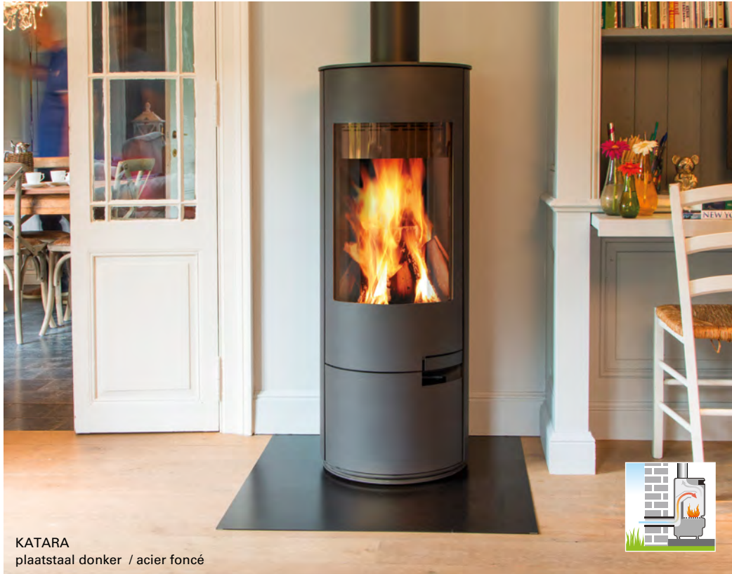
KATARA plaatstaal donker / acier foncé

Mooie, strakke volledig afgeronde kachel.