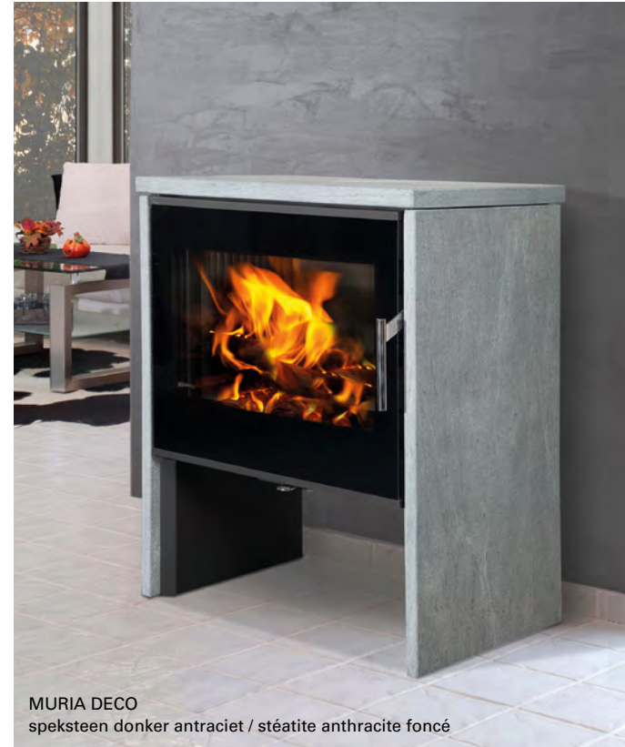
MURIA DECO speksteen donker antraciet / stéatite anthracite foncé

Een breed vlammenbeeld in een verfijnd modern jasje.