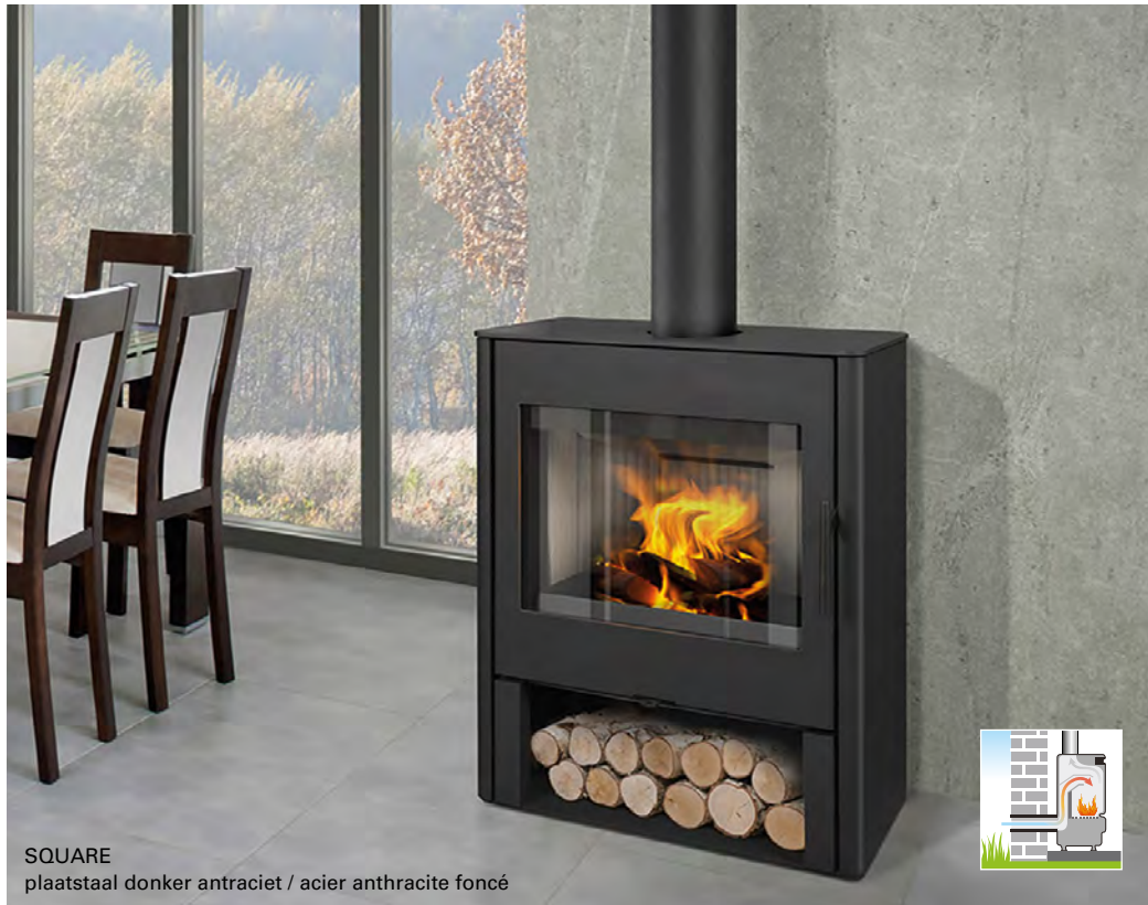
SQUARE plaatstaal donker antraciet / acier anthracite foncé

De Square staat voor kubistische eenvoud.