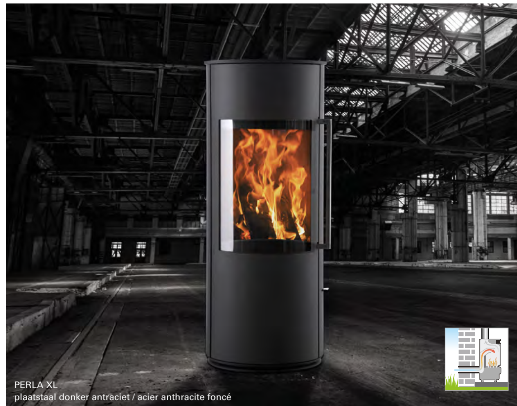
PERLA XL plaatstaal donker antraciet / acier anthracite foncé