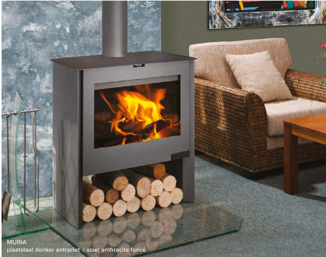
MURIA plaatstaal donker antraciet / acier anthracite foncé

Traditionele harmonieuze vormgeving die zich beperkt tot de essentie.