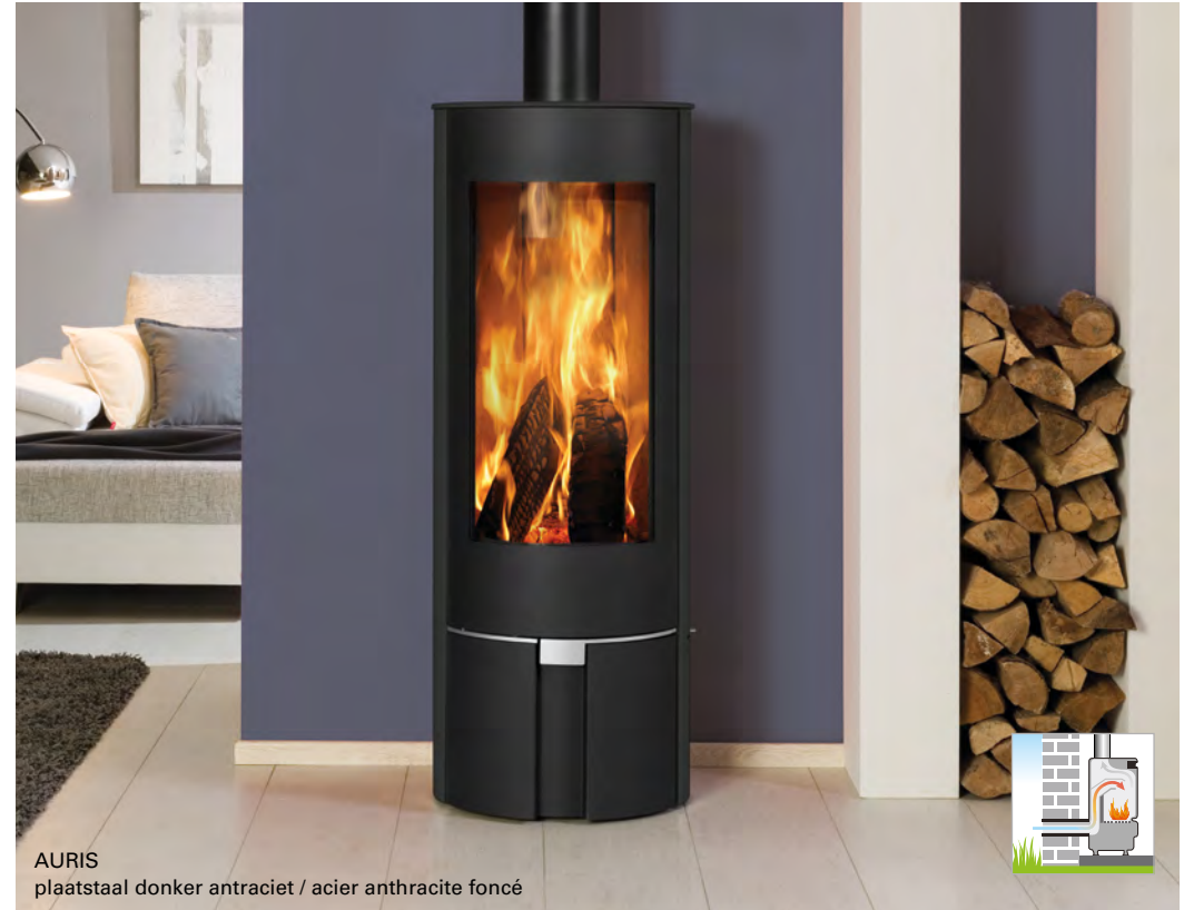
AURIS plaatstaal donker antraciet / acier anthracite foncé

Ronde, hoge stijlvolle houtkachel met een betoverend vlammenspel !