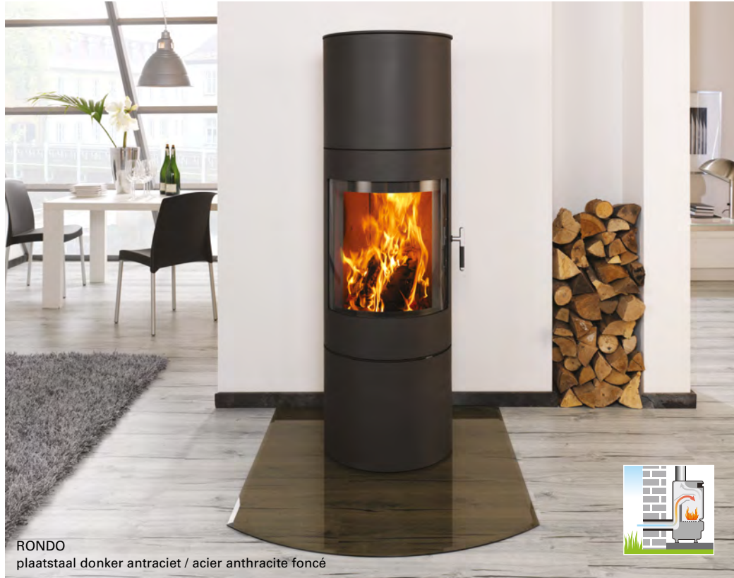
RONDO plaatstaal donker antraciet / acier anthracite foncé