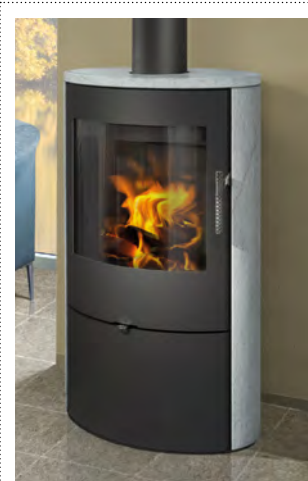
ELEGANT speksteen / stéatite