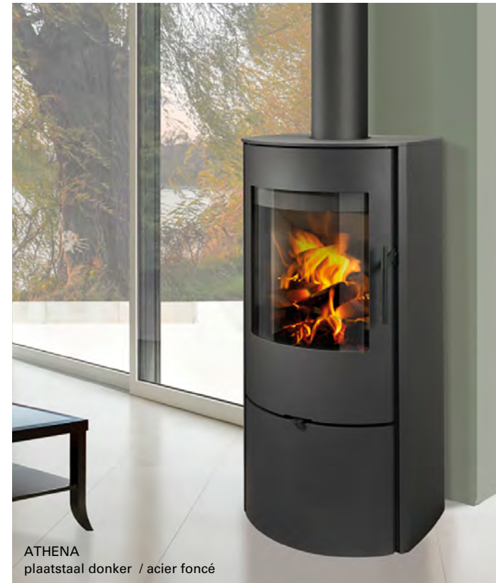
ATHENA plaatstaal donker / acier foncé

De Athena is een verfijnde kachel met een onopvallend ingewerkte houtopslag.